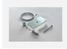
145-50305, N Seile an Profilverbindung 6000mm - 1 Stk. + Metallhalter