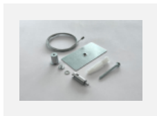
145-50305, N Seile an Profilverbindung 6000mm - 1 Stk. + Metallhalter