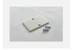
145-50101, S 2 x Metall-Endkappe mit Schrauben