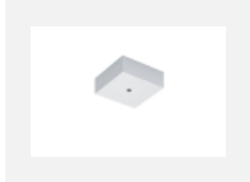
00-00370, W Deckenkappe 80x80x32mm