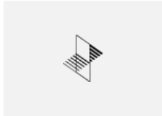
145-20700, S Wandhalter (2 Stk) Lina45