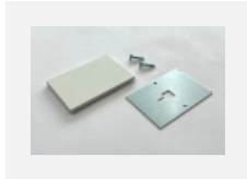
145-50102, S 2 x Metall-Endkappe ohne Schrauben