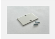
145-50101, S 2 x Metall-Endkappe mit Schrauben