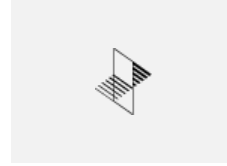
145-20700, W Wandhalter (2 Stk) Lina45