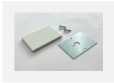
145-50102, W 2 x Metall-Endkappe ohne Schrauben