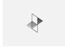
145-20700, W Wandhalter (2 Stk) Lina45