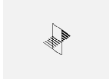
145-01200, F Zubehör für Demontage El. Modules für Lina145