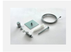
145-50302, N Seile 6000mm + Metallhalter;