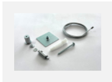
145-50302, N Seile 6000mm + Metallhalter;