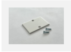
145-50101, S 2 x Metall-Endkappe mit Schrauben