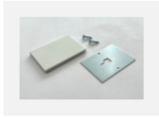
145-50102, S 2 x Metall-Endkappe ohne Schrauben