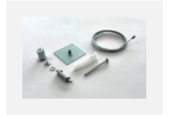
145-50301, N Seile 4000mm + Metallhalter;