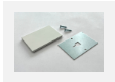
145-50102, W 2 x Metall-Endkappe ohne Schrauben