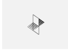
145-20700, W Wandhalter (2 Stk) Lina45