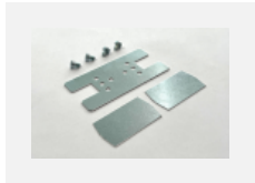
145-50200, F direkter Veerbinder mit Abdeckung