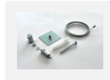
145-50302, N Seile 6000mm + Metallhalter;