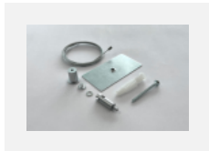
145-50304, N Seile an Profilverbindung 4000mm - 1 Stk. + Metallhalter