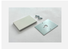
145-50102, B 2 x Metall-Endkappe ohne Schrauben