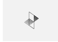
145-20700, B Wandhalter (2 Stk) Lina45