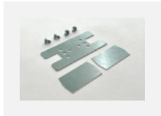
145-50200, F direkter Veebinder mit Abdeckung