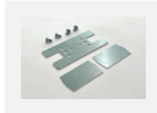
145-50200, F direkter Veebinder mit Abdeckung