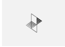
145-20700, S Wandhalter (2 Stk) Lina45