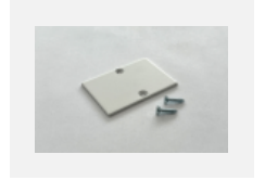
145-50101, S 2 x Metall-Endkappe mit Schrauben