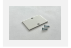
145-50101, S 2 x Metall-Endkappe mit Schrauben