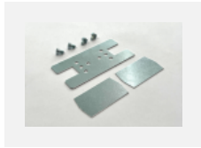
145-50200, F direkter Veerbinder mit Abdeckung