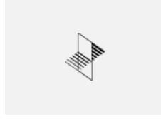
145-20700, S Wandhalter (2 Stk) Lina45