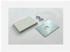
145-50102, S 2 x Metall-Endkappe ohne Schrauben