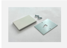
145-50102, S 2 x Metall-Endkappe ohne Schrauben