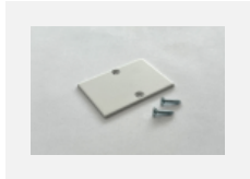
145-50101, W 2 x Metall-Endkappe mit Schrauben