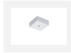
00-00370, W Deckenkappe 80x80x32mm