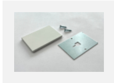
145-50102, W 2 x Metall-Endkappe ohne Schrauben