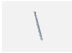
00-00354, K Kabel 5x0,75 1000mm