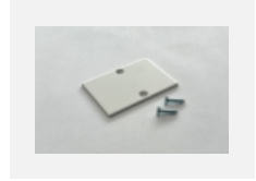
145-50101, S 2 x Metall-Endkappe mit Schrauben