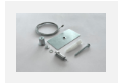
145-50303, N Seile an Profilverbindung 2000mm - 1 Stk. + Metallhalter