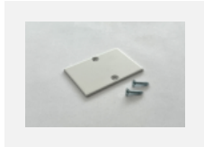
145-50101, W 2 x Metall-Endkappe mit Schrauben