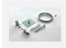
145-50300, N Seile 2000mm + Metallhalter;