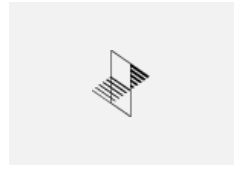
145-01200, F Zubehör für Demontage El. Modules für Lina145