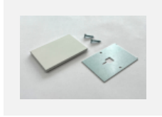
145-50102, S 2 x Metall-Endkappe ohne Schrauben