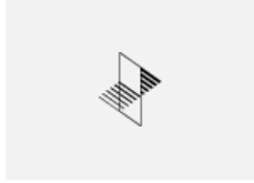
145-20700, S Wandhalter (2 Stk) Lina45