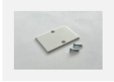
145-50101, S 2 x Metall-Endkappe mit Schrauben