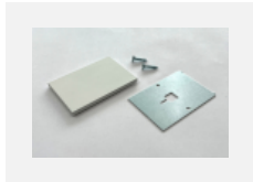
145-50102, W 2 x Metall-Endkappe ohne Schrauben