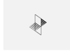
145-20700, W Wandhalter (2 Stk) Lina45