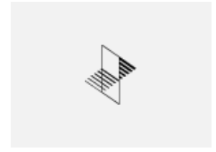
145-01200, F Zubehör für Demontage El. Modules für Lina145