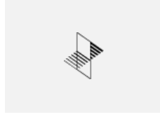
145-20700, W Wandhalter (2 Stk) Lina45