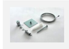
145-50300, N Seile 2000mm + Metallhalter;