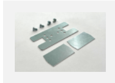
145-50200, F direkter Veebinder mit Abdeckung