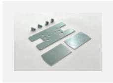
145-50200, F direkter Veebinder mit Abdeckung