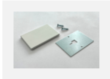
145-50102, S 2 x Metall-Endkappe ohne Schrauben