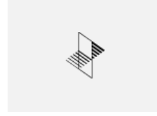
145-20700, W Wandhalter (2 Stk) Lina45