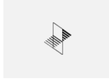
145-01200, F Zubehör für Demontage El. Modules für Lina145