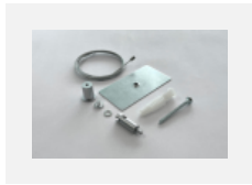
145-50304, N Seile an Profilverbindung 4000mm - 1 Stk. + Metallhalter