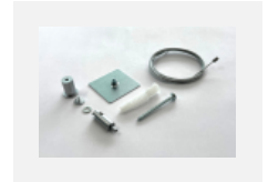
145-50301, N Seile 4000mm + Metallhalter;