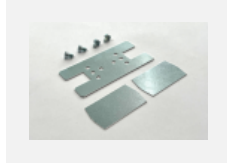
145-50200, F direkter Veebinder mit Abdeckung