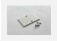
145-50101, B 2 x Metall-Endkappe mit Schrauben