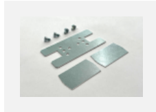
145-50200, F direkter Veebinder mit Abdeckung