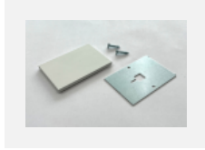
145-50102, W 2 x Metall-Endkappe ohne Schrauben