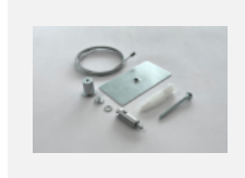
145-50305, N Seile an Profilverbindung 6000mm - 1 Stk. + Metallhalter