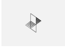
145-20700, B Wandhalter (2 Stk) Lina45