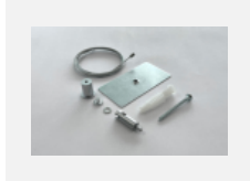
145-50304, N Seile an Profilverbindung 4000mm - 1 Stk. + Metallhalter