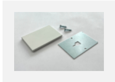
145-50102, B 2 x Metall-Endkappe ohne Schrauben