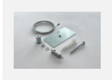
145-50303, N Seile an Profilverbindung 2000mm - 1 Stk. + Metallhalter