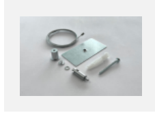
145-50305, N Seile an Profilverbindung 6000mm - 1 Stk. + Metallhalter