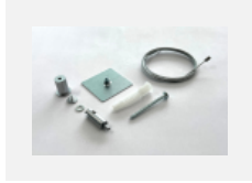
145-50302, N Seile 6000mm + Metallhalter;