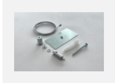
145-50304, N Seile an Profilverbindung 4000mm - 1 Stk. + Metallhalter