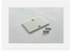
145-50101, B 2 x Metall-Endkappe mit Schrauben