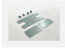
145-50200, F direkter Veebinder mit Abdeckung