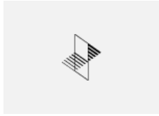
145-20700, W Wandhalter (2 Stk) Lina45