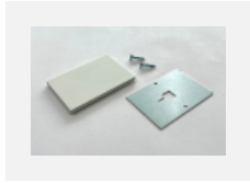
145-50102, W 2 x Metall-Endkappe ohne Schrauben