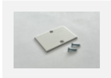
145-50101, W 2 x Metall-Endkappe mit Schrauben