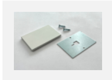
145-50102, W 2 x Metall-Endkappe ohne Schrauben