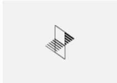
145-20700, W Wandhalter (2 Stk) Lina45