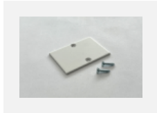
145-50101, B 2 x Metall-Endkappe mit Schrauben