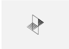
145-20700, B Wandhalter (2 Stk) Lina45