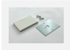
145-50102, B 2 x Metall-Endkappe ohne Schrauben