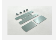
145-50200, F direkter Veebinder mit Abdeckung