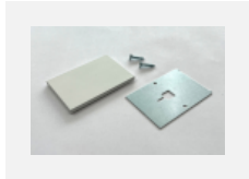
145-50102, W 2 x Metall-Endkappe ohne Schrauben