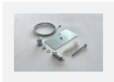
145-50304, N Seile an Profilverbindung 4000mm - 1 Stk. + Metallhalter