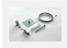
145-50300, N Seile 2000mm + Metallhalter;