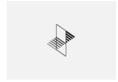
145-01200, F Zubehör für Demontage El. Modules für Lina145