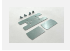
145-50200, F direkter Veebinder mit Abdeckung