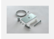
145-50304, N Seile an Profilverbindung 4000mm - 1 Stk. + Metallhalter