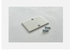
145-50101, W 2 x Metall-Endkappe mit Schrauben