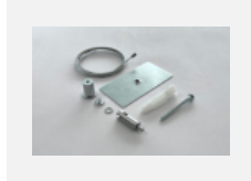
145-50305, N Seile an Profilverbindung 6000mm - 1 Stk. + Metallhalter