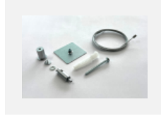
145-50300, N Seile 2000mm + Metallhalter;