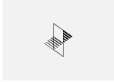
145-20700, W Wandhalter (2 Stk) Lina45