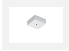
00-00370, W Deckenkappe 80x80x32mm