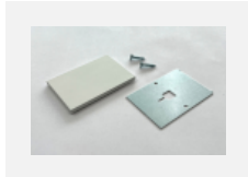
145-50102, B 2 x Metall-Endkappe ohne Schrauben