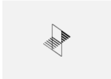
145-20700, B Wandhalter (2 Stk) Lina45