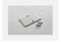
145-50101, B 2 x Metall-Endkappe mit Schrauben