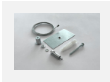
145-50305, N Seile an Profilverbindung 6000mm - 1 Stk. + Metallhalter