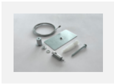
145-50304, N Seile an Profilverbindung 4000mm - 1 Stk. + Metallhalter