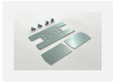
145-50200, F direkter Veerbinder mit Abdeckung