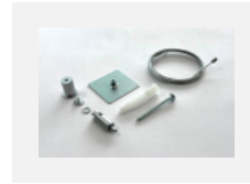
145-50302, N Seile 6000mm + Metallhalter;