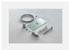
145-50304, N Seile an Profilverbindung 4000mm - 1 Stk. + Metallhalter