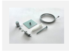
145-50301, N Seile 4000mm + Metallhalter;