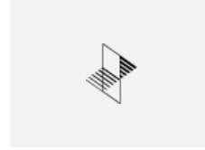
145-20700, B Wandhalter (2 Stk) Lina45