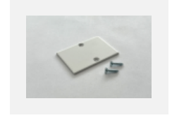
145-50101, B 2 x Metall-Endkappe mit Schrauben