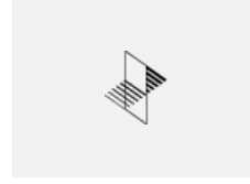
145-20700, B Wandhalter (2 Stk) Lina45