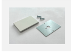
145-50102, B 2 x Metall-Endkappe ohne Schrauben